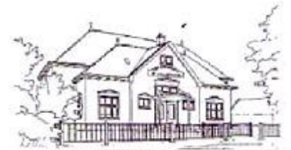
Cbs De Crangeborg