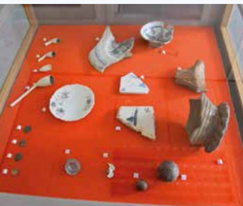
Archeologische vondsten Middelstum

In Middelstum wilden de bewoners van de Grachtstraat geen klinkers in verband met te verwachten trillingen; er was voorkeur voor asfalt. Dat terwijl het gebruiken van gebakken materiaal een uitgangspunt was voor het ontwerp. Er zijn veel overlegsessies geweest over de technische aanpak van de inrichting van de straat en de beeldkwaliteit. Met voorzieningen om het zwaardere verkeer om te leiden en een maximumsnelheid van 30 kilometer per uur, vonden de inwoners en de gemeente elkaar. Les: luisteren en waar dat kan tegemoet komen.