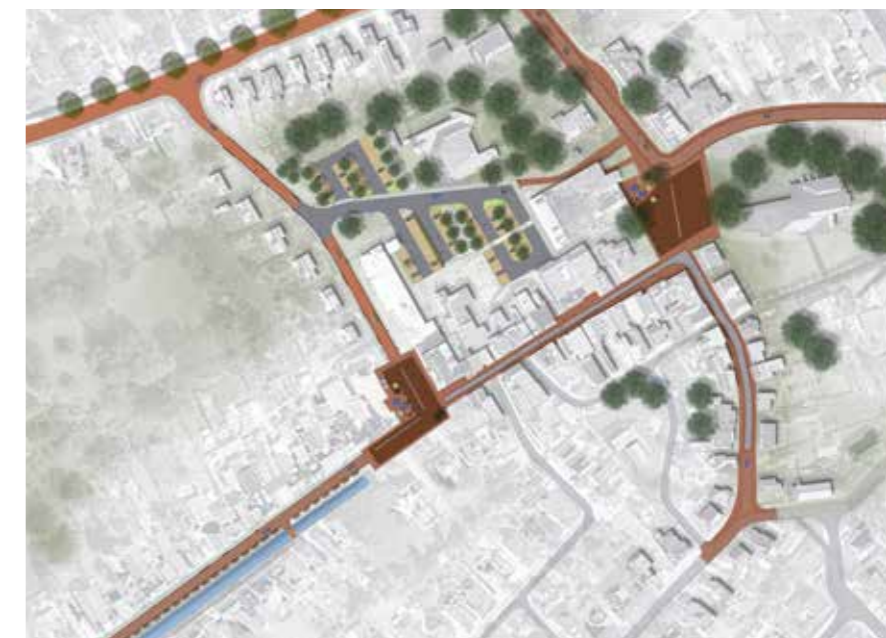
Planontwerp Loppersum Centrum

“Het is sterk om de projecten te evalueren en daadwerkelijk onderdelen te herstellen als blijkt dat iets niet werkt in de praktijk.”