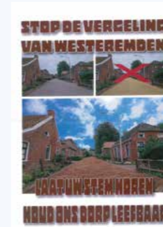
Affiche actiecomité Westeremden