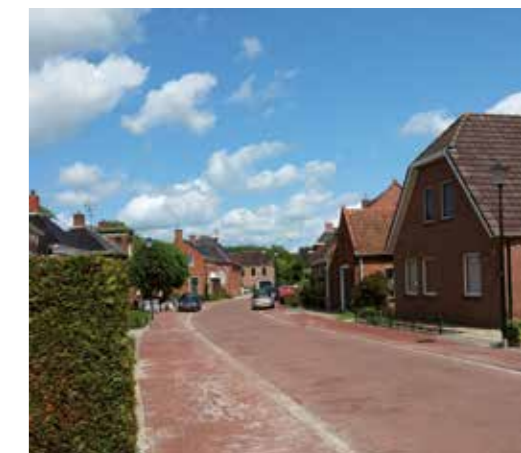
Middelstum Oude Schoolsterweg