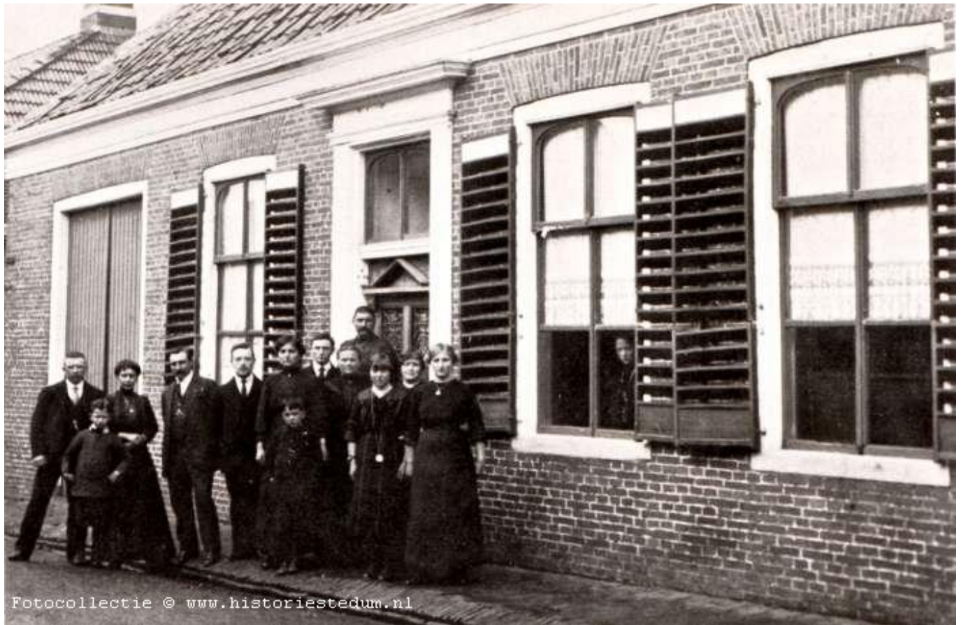
(Gevluchte Belgen 1914)

Voor het huis Hoofdstraat 39 Belgische vluchtelingen onder wie enkele kinderen. Achter het raam staat ook nog iemand. De foto is gemaakt in 1914.